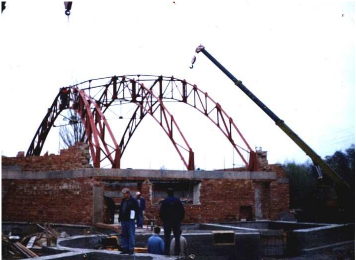
Usazování konstrukce stropu 6. dubna 1998.