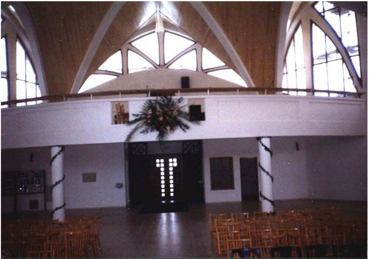
6. 12. 1998 byl kostel připraven ke svěcení.