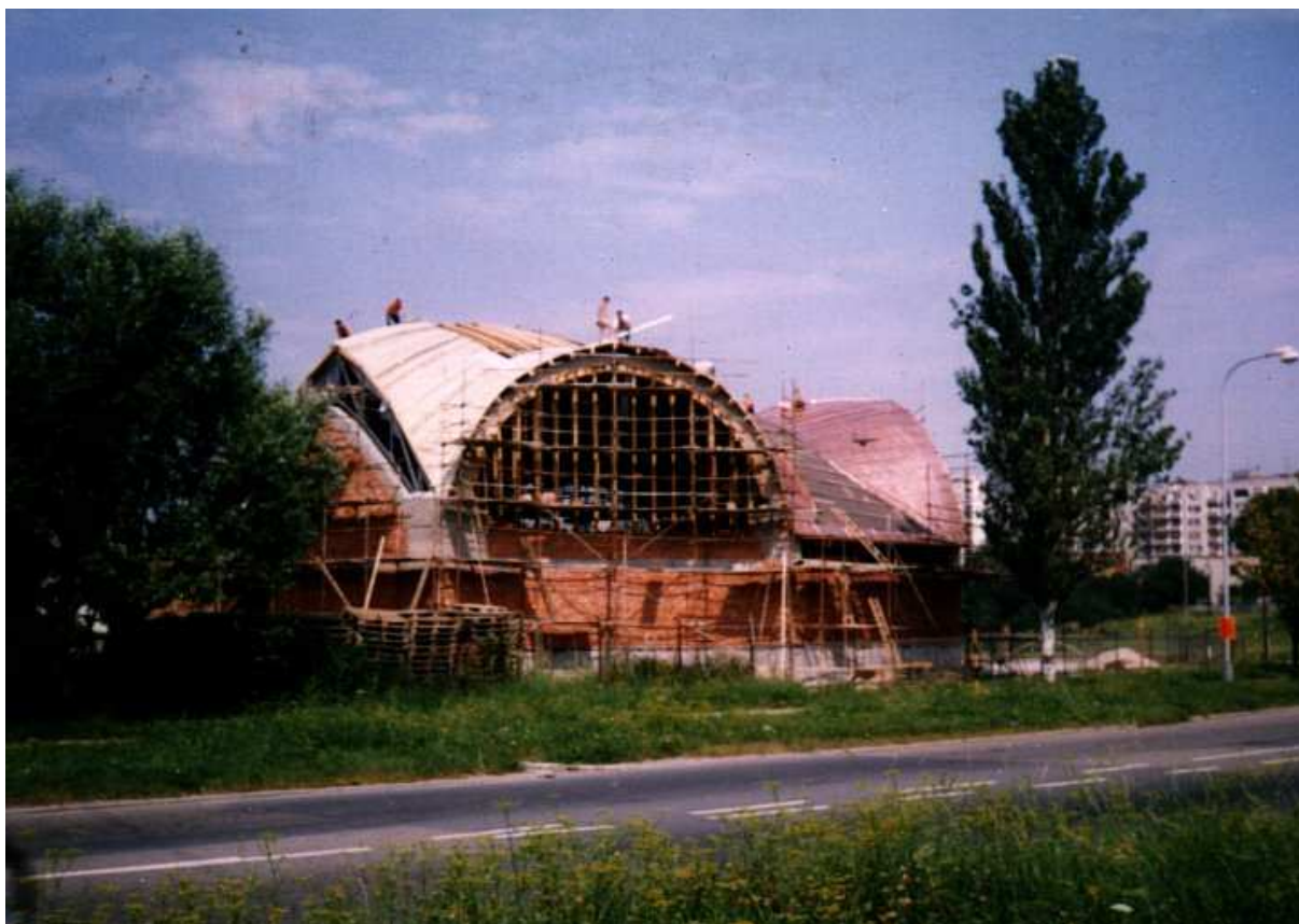
Pokrývání střechy měděným plechem v srpnových vedrech.