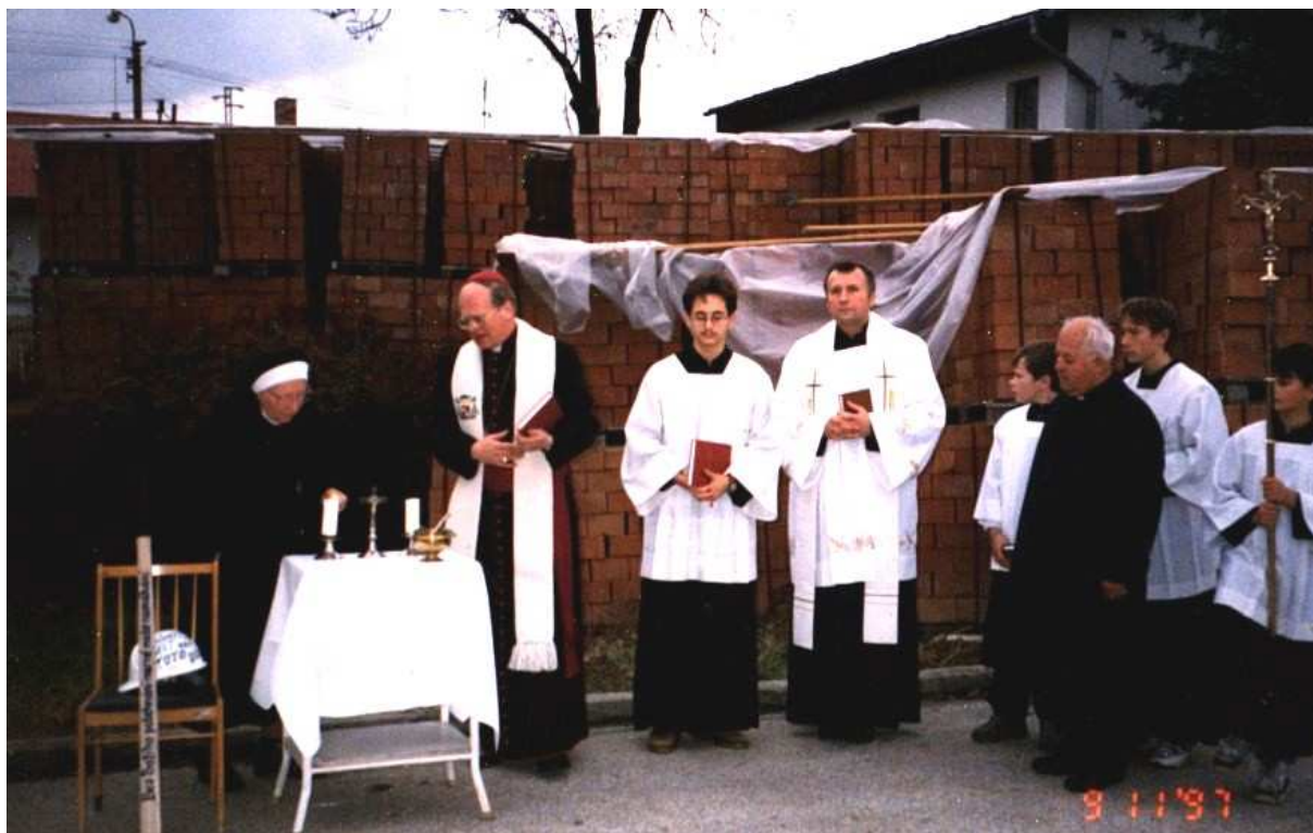
Svěcení staveniště v listopadu 1997.