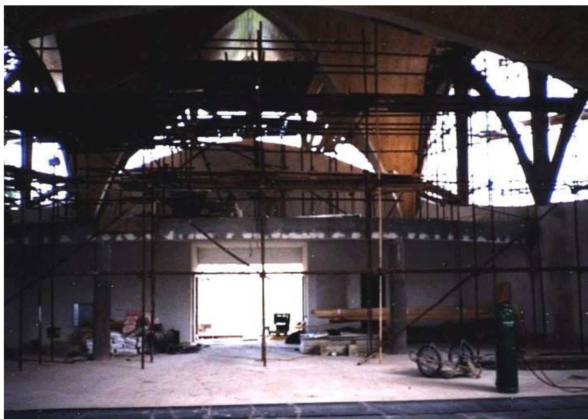
Stěhování lešení z interiéru začalo koncem října 1998.