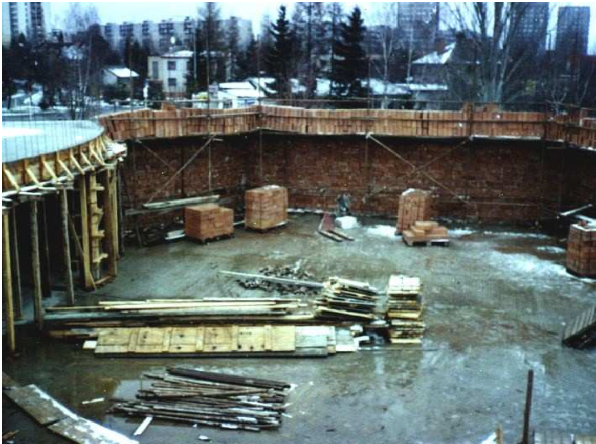
Obvodové zdivo bylo dokončeno již 21. března a začala betonáž věnce a desky kůru.