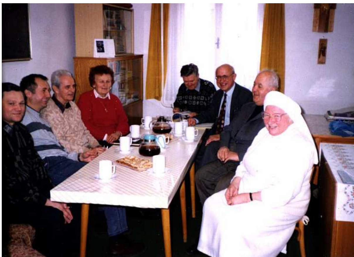
Koordinační rada v lednu 1998.