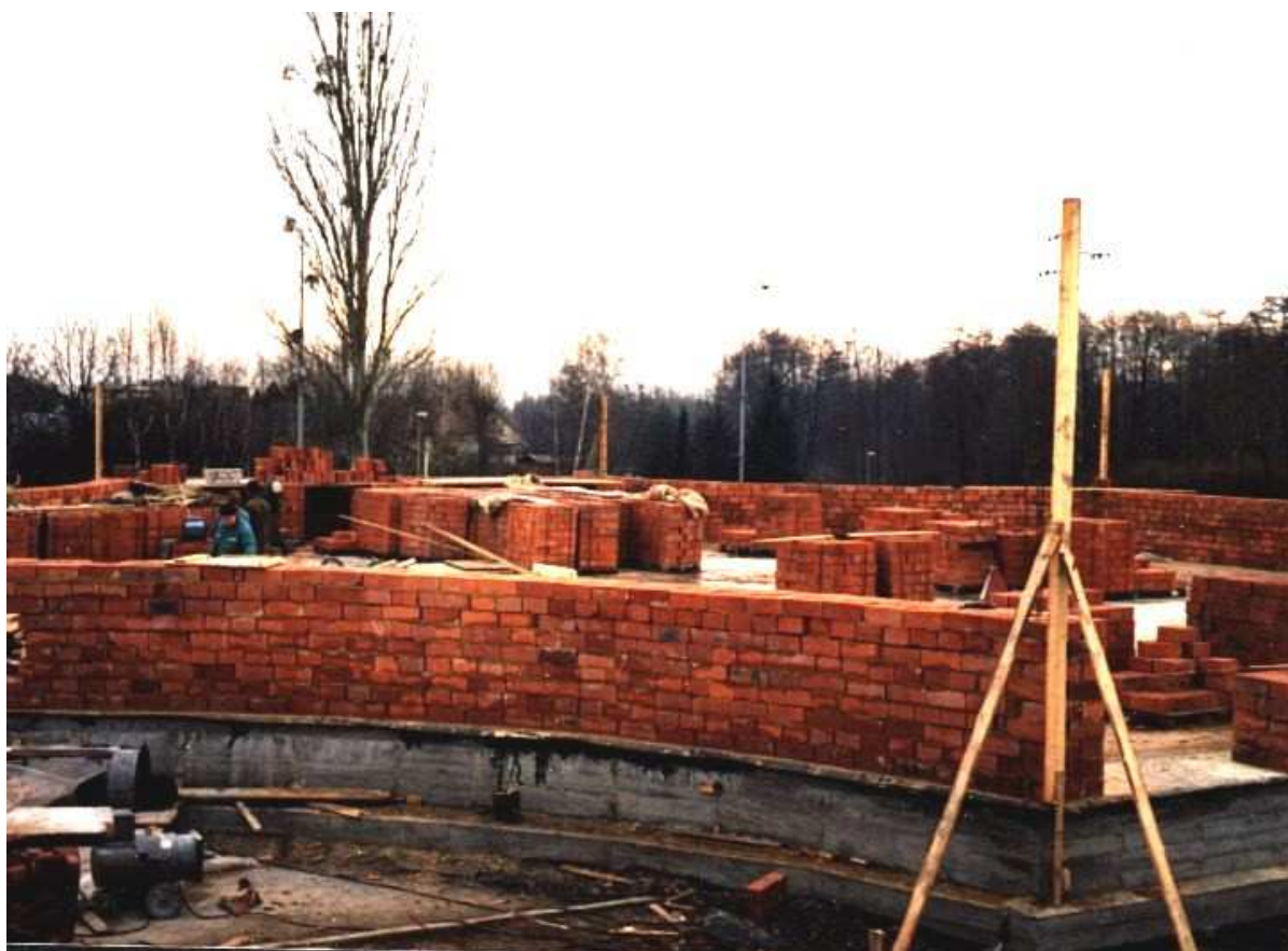
Počátek zdění. Snímek je z 11. 2. 1998.