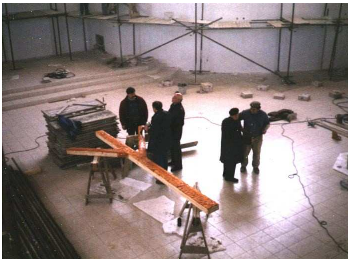
Poslední úpravy kříže před jeho zavěšením v presbytáři.