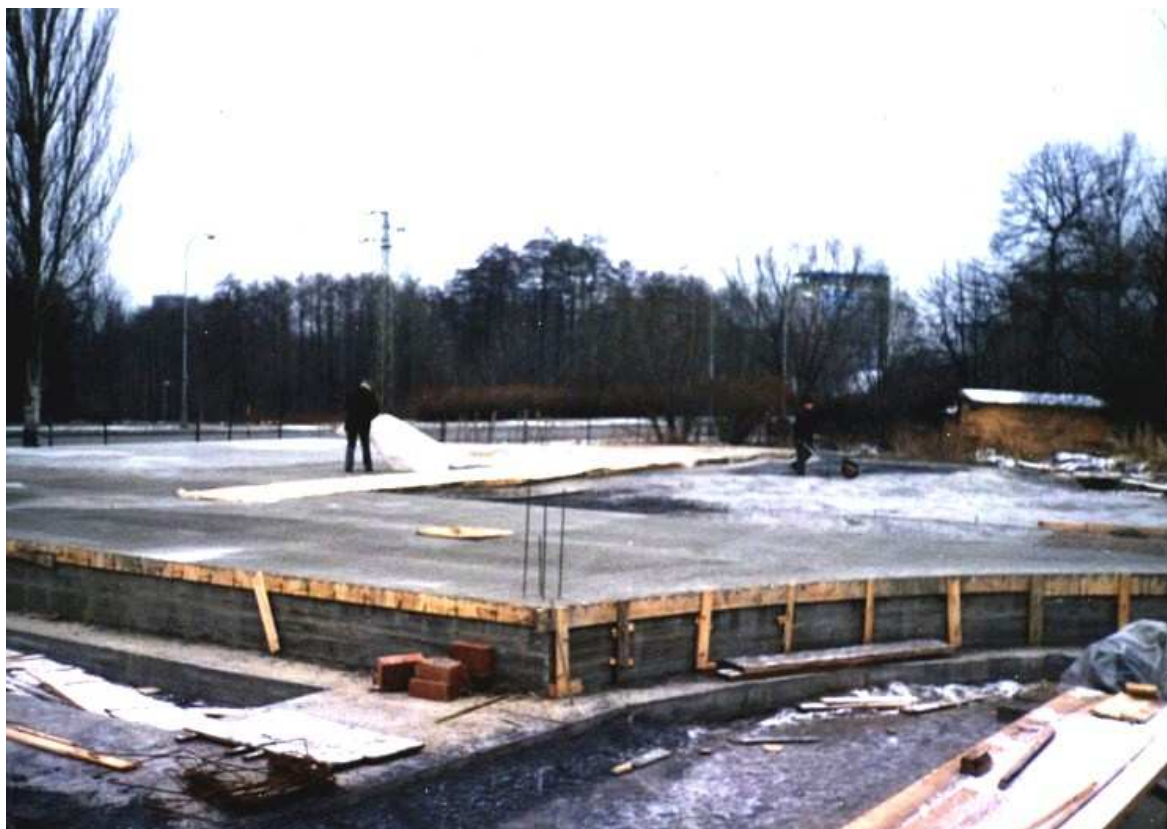
23. ledna byla hotová betonová roznášecí deska a pro ochranu před mrazem byla přikryta plastickou folií.