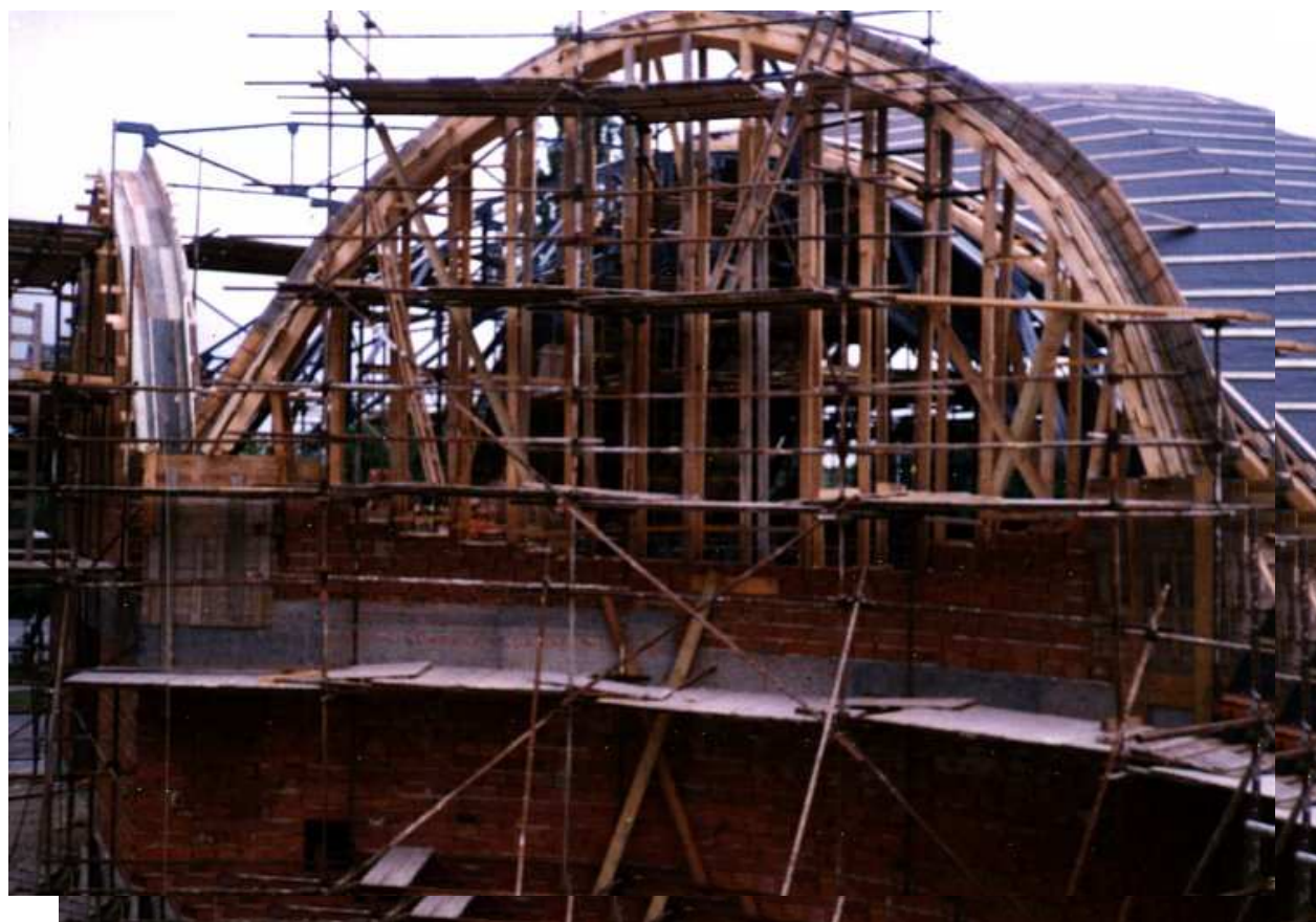
Složité bednění pro betonáž okenních oblouků z poloviny června.