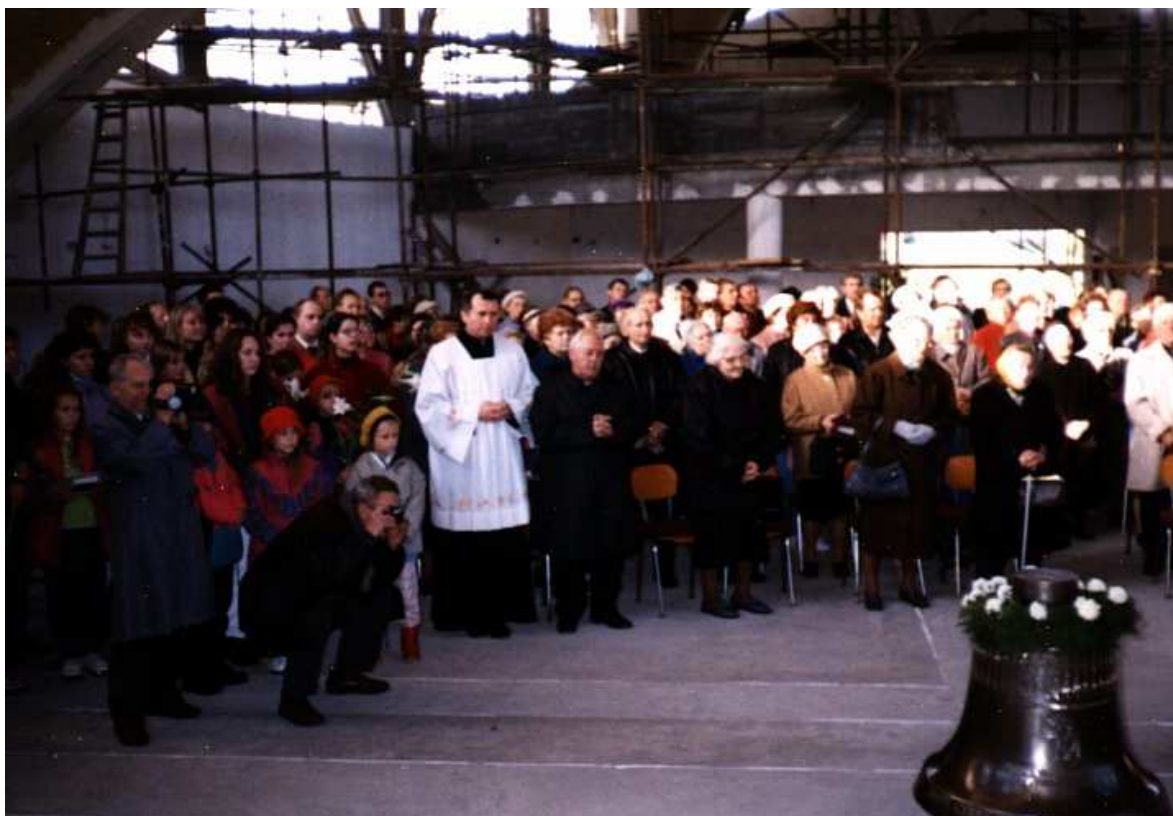
Při svěcení zvonů 31. října se poprvé zaplnil prostor kostela věřícími z farnosti.