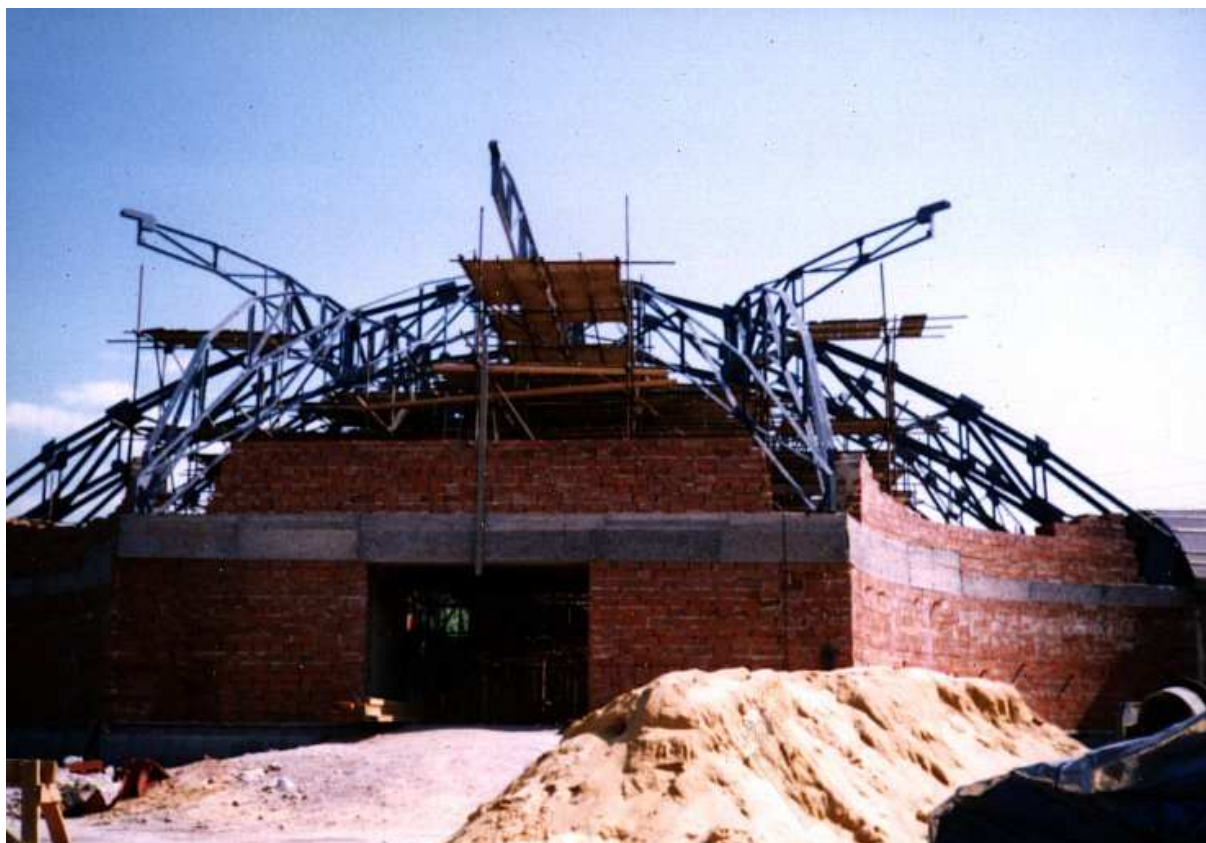
6. června 1998 byla konstrukce připravena pro stavbu krovu.